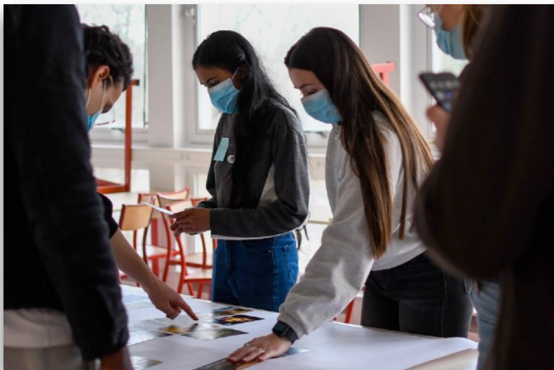
Des centaines d'entreprises et dizaines de milliers de salariés