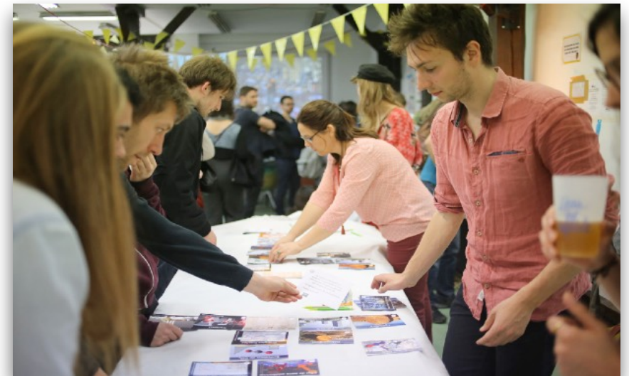
Des dizaines de milliers de citoyens